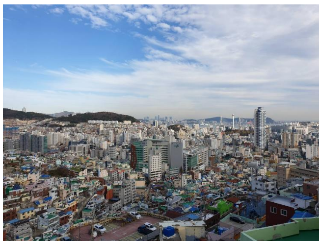
從山坡上可以看到 廣闊的釜山市景

很喜歡這次的出遊，多虧參與學院安排的行程，可以親身探訪在地的釜山，這個景點因為目前沒有什麼中文觀光介紹，所以如果不是跟學院來，恐怕難以知道有這樣的地方～不只是風景壯闊、精美壁畫裝置別出心裁，走在歷史記憶堆疊的一磚一瓦、穿梭釜山居民民宅感受在地氣息脈動，得以一窺老釜山與韓國的生顏(생얼)。